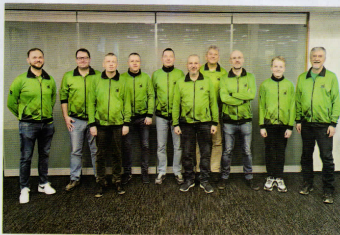
ŠK Slavoj Poruba, A tým

♦ Dokážete si představit, že by v nejvyšší španělské fotbalové soutěži hrály dva týmy FC Barcelony? Nebo že by v NHL figurovaly dva mančafy Floridy Panthers? Představit možná, ale za současných sportovních pravidel je to nereálné. Porubský tým se však o podobnou senzaci postaral.